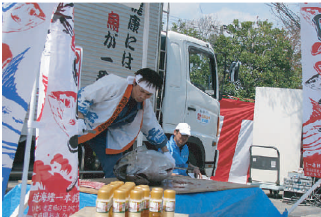
4月2日にフローランテ宮崎にて行われた初かつおフェアにて、マグロの解体ショーが行われました。