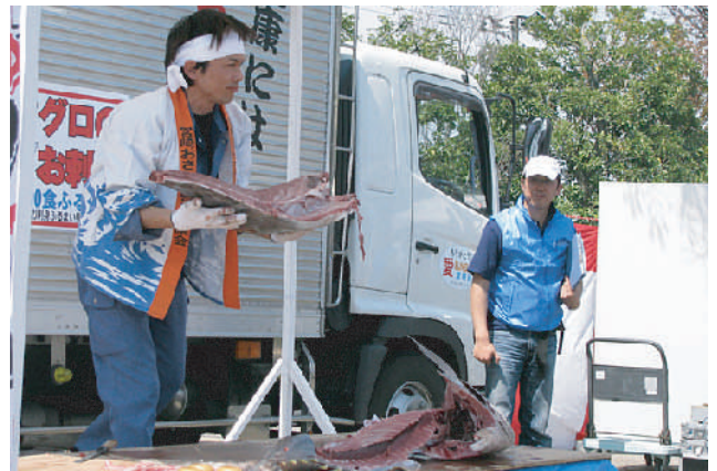
鮮やかな職人技で、大きなマグロが瞬く間に切り身になっていきました。