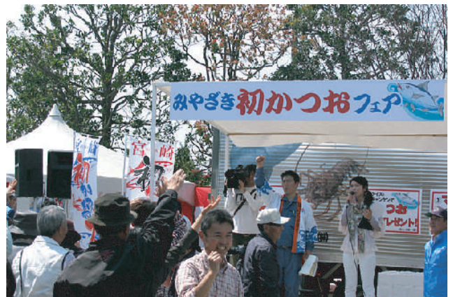
初かつおプレゼント企画のひとつじゃんけん大会が行われました。