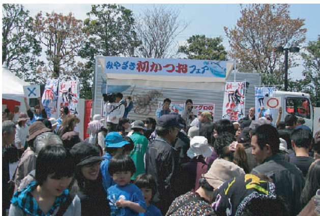
じゃんけん大会の他に ×クイズも行われました。こちら初かつおがプレゼントされました。