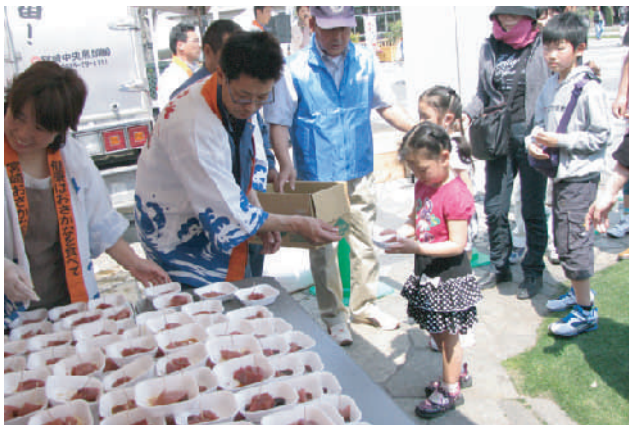
解体されたマグロは、限定500食が来場者へ振る舞われました。