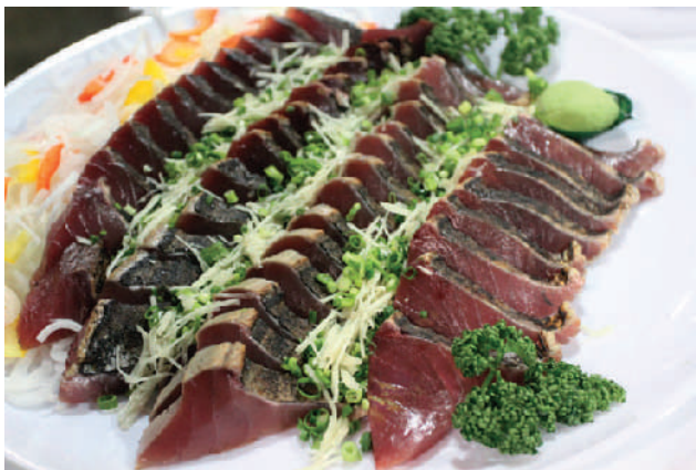
今回のフェアでは皮の部分のみを炙って食べる、「焼っ切り」が目玉です。