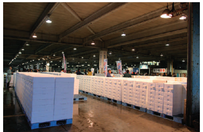
近海鰹一本釣りで日本一ということもあり、今回のフェアに向けた意気込みが伝わる熱気あるのぼり渡し式でした。