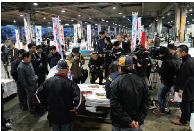
多くのメディア、観客に取り上げてもらいフェアのPRも上々でした。