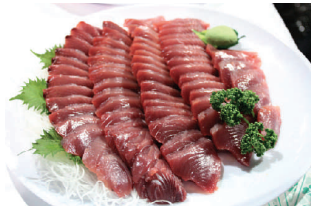
春が旬の初かつお。イベントでは解体ショーも行われ鮮度抜群の初かつおが振る舞われる予定です。