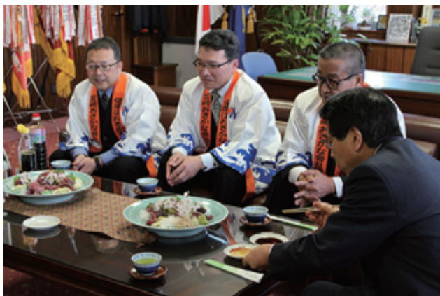
初かつおを囲んでフェアの内容を交えながら、宮崎の水産の話題に熱が入ります。