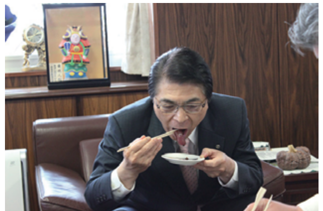
早速市長に初かつおを召し上がっていただきました。今年も旬な味覚にご満悦の様子でした。