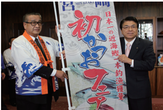
のぼり旗にもフェアへの期待が込められた力強さを感じられます。