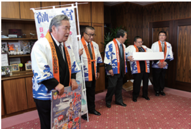
宮崎市長へ初かつおフェアのPRを兼ねて表敬訪問を行いました。