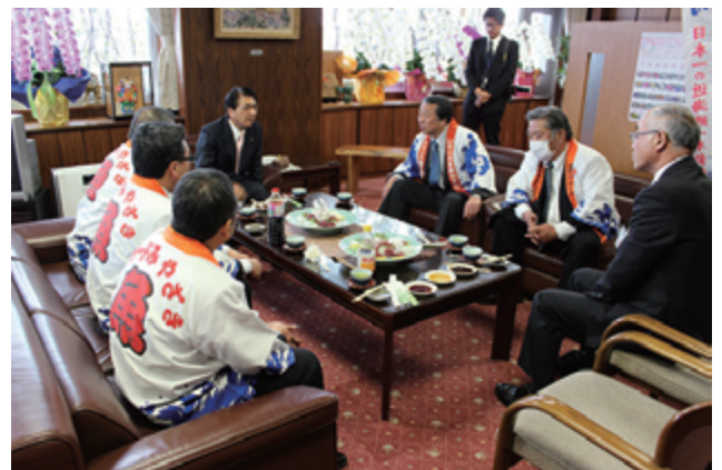
市長からの激励の言葉も頂き、一層フェアへの取り組みに力が入る思いです。